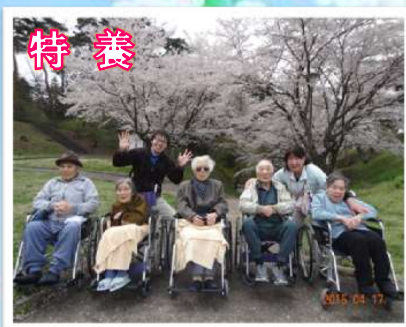
4月17日(金) 翠ヶ丘公園 今週は雨で心配しましたが、桜も散らずに 待っててくれました。みんないい笑顔ですね。