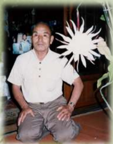
貴重な月下美人とともに。