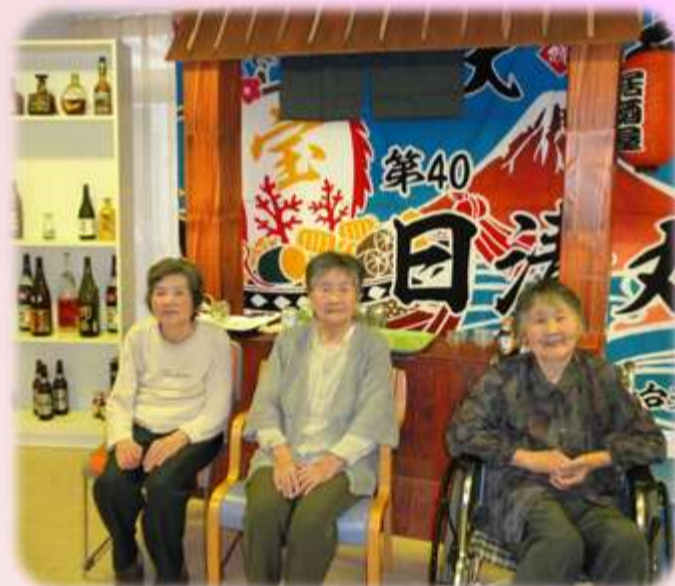
ゆう遊館 行事 居酒屋での一枚 平成24年5月(中央)