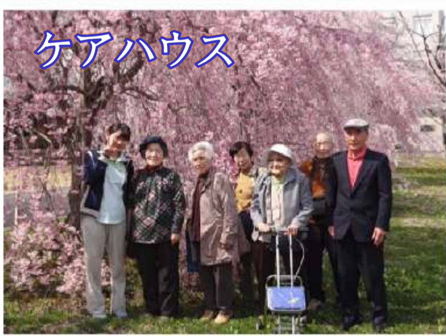
4月16日(木) 日大・笹原川の千本桜 みごとな晴天！気温も温かく、花見には最 高の日でした。