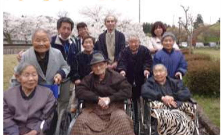
4月15日(水) 翠ヶ丘公園 雨の予報でしたが、午前中はなんとか 天気が持ちました♪