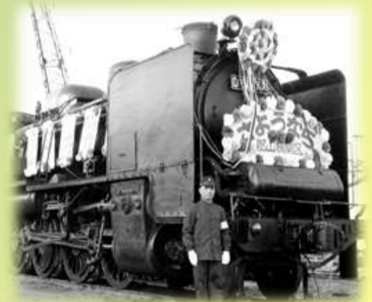
機関士時代の舞木さん。 (50代半ば頃)